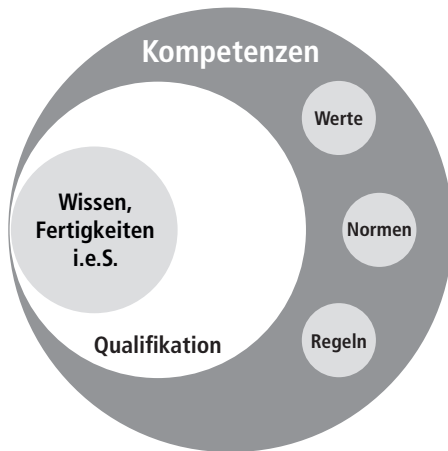
Abbildung 3: Eigene Darstellung von Karl Drack nach Erpenbeck/Rosenstiel

Kompetenzen charakterisieren in diesem Modell die Fähigkeiten eines Menschen, sich selbstorganisiert in neuen, offenen, komplexen Situationen zurechtzufinden und proaktiv zu handeln. Wissen, Fertigkeiten, Qualifikationen, ... alleine sind noch keine Kompetenz. Zum hier verwendeten Kompetenzbegriff ist die Charakterisierung von Keim/Wittmann sehr treffend: „Wirklich kompetent wird nur, wer aus Erfahrungen und Erlebnissen handelt und lernt, wer sich auf Neues einlässt – und daraus seine Schlüsse zieht, wer zum Experten seiner selbst wird. All das geht aber nur, wenn für das eigene Tun notwendige, in Form eigener Emotionen und Motivationen angeeignete (interiorisierte) Werte und Normen zugelassen werden.“